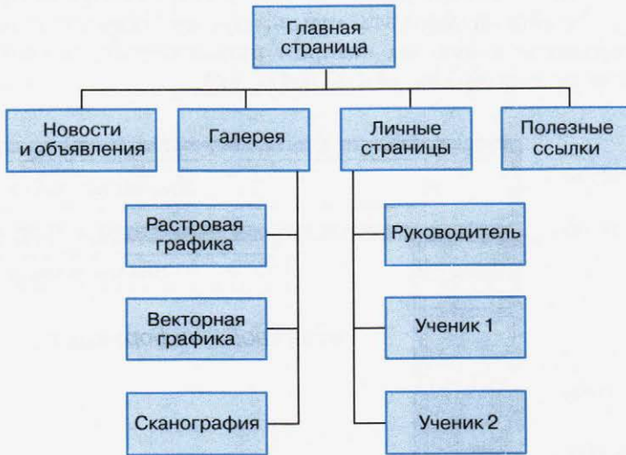
Рис. 4.8. Иерархическая структура сайта

Очевидно, сайт может включать в себя общую информацию (программу и расписание занятий, место проведения занятий, фамилию, имя, отчество руководителя и т. д.), страницу новостей и объявлений, личные страницы руководителя и участников объединения, галерею работ участников объединения, полезные ссылки на другие ресурсы сети Интернет и многое другое. Изобразим структуру сайта в виде графа (рис. 4.8).