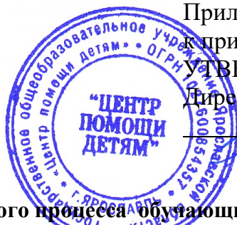
График образовательного процесса обучающихся в Школе дистанционного обучения ГБОУ ЯО «Центр помощи детям»