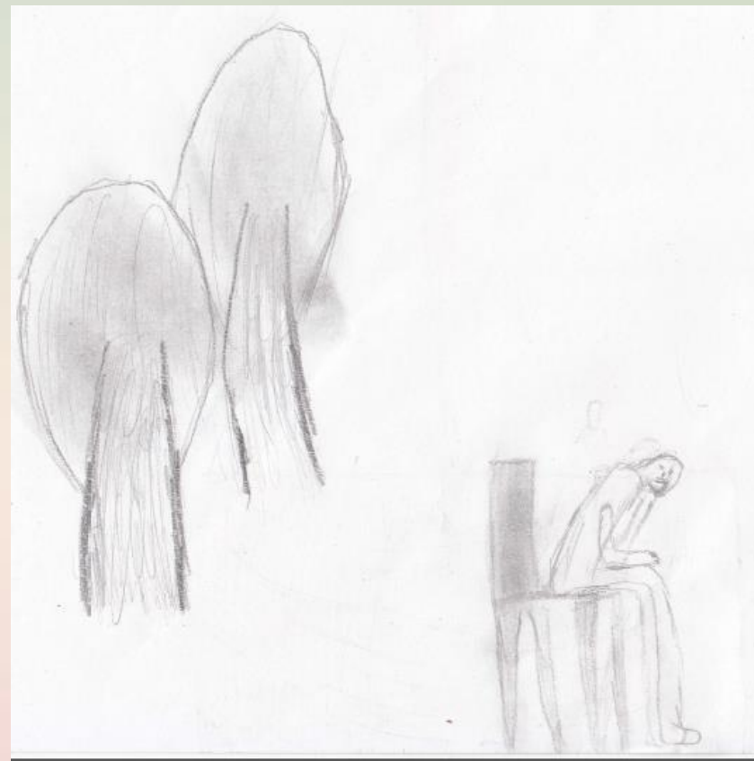
Рисунок чувств и эмоций. «Моя грусть», «Моя обида», «Моя тревога», «Мое напряжение».

Осознание и вербализация эмоциональных состояний.