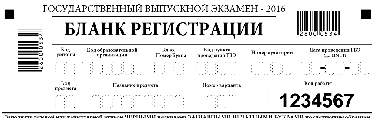
Рис. 2. Верхняя часть бланка регистрации

Поля верхней части бланка регистрации (рис. 2) заполняются участниками ГВЭ частично с использованием информации, подготовленной организаторами на доске, частично самостоятельно (см. Таблицу 1). Поле «Код работы» заполнено типографским способом.