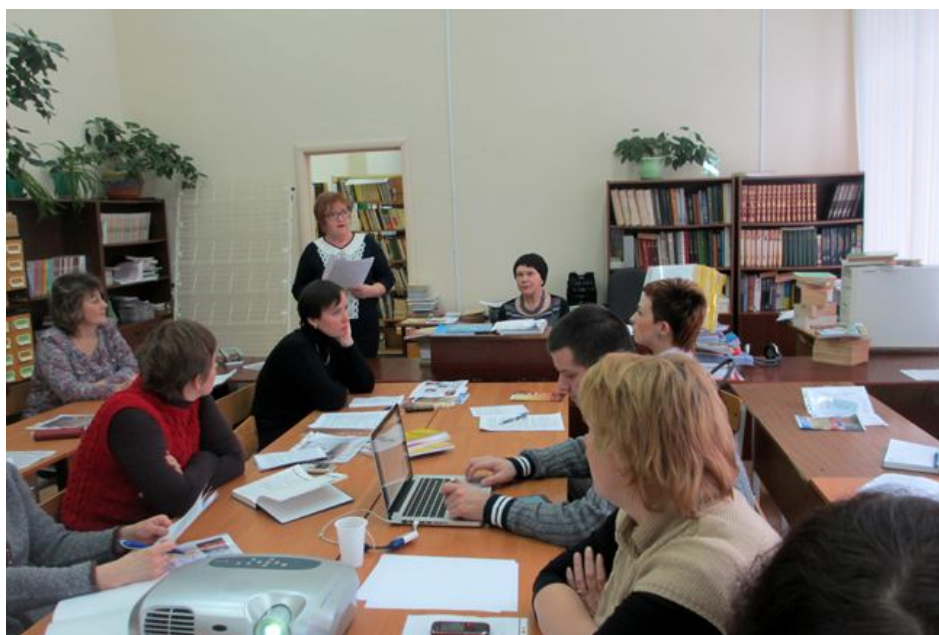
Заседание секции «Профессиональная ориентация и профессиональная подготовка лиц с ограниченными возможностями здоровья»